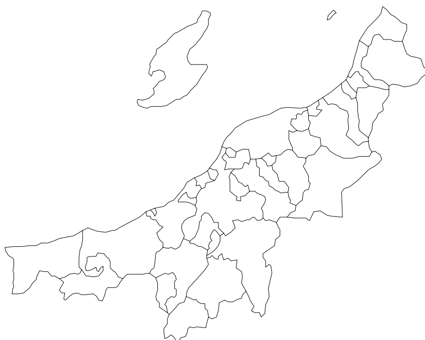
图2 分県地图 (新潟県)